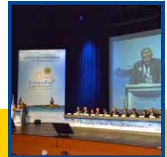
59. Lions Avrupa Forumu Ardından