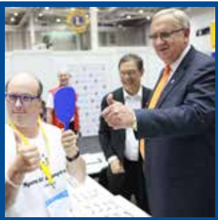
Yeni Görevler Üstlenme LCIF Özel Olimpiyatlarla Olan İşbirliğini Geliştiriyor