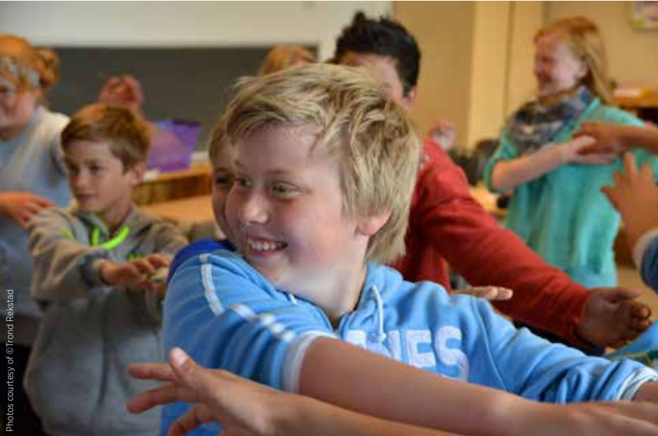
Öğrenciler, sınıflarını bir saatliğine değiştiren Lions Quest aktivitesinde yer aldılar.